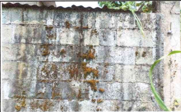
Foto1: SUSTITUCION DE PAREDES