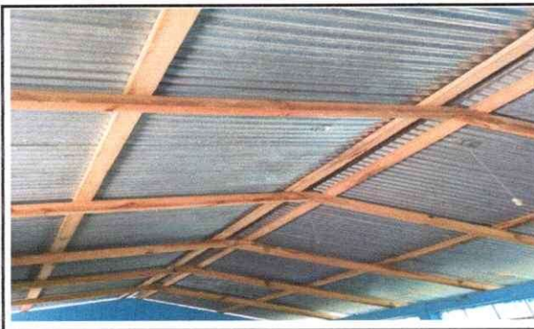
SUSTITUCION DE VIGA